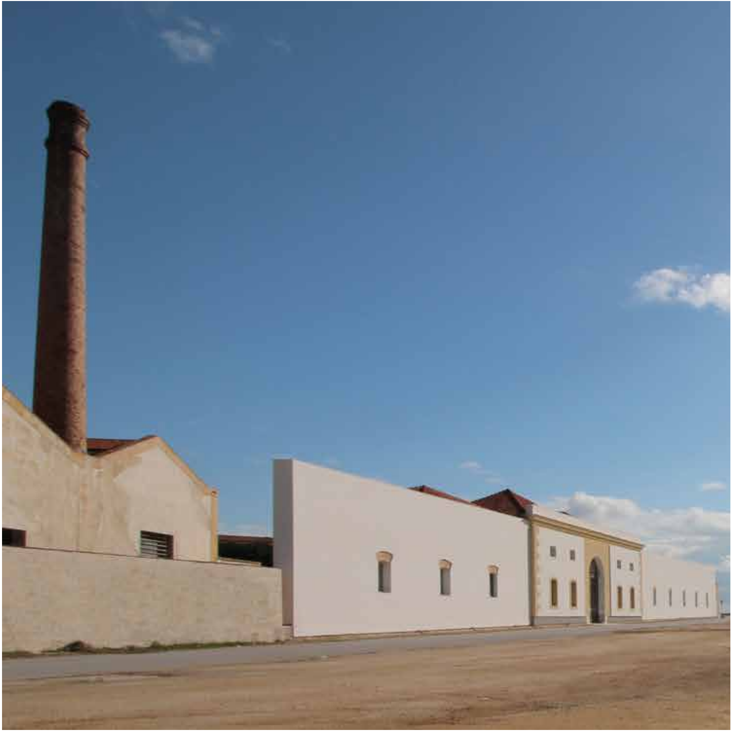
La Cantina, Marsala The winery, Marsala