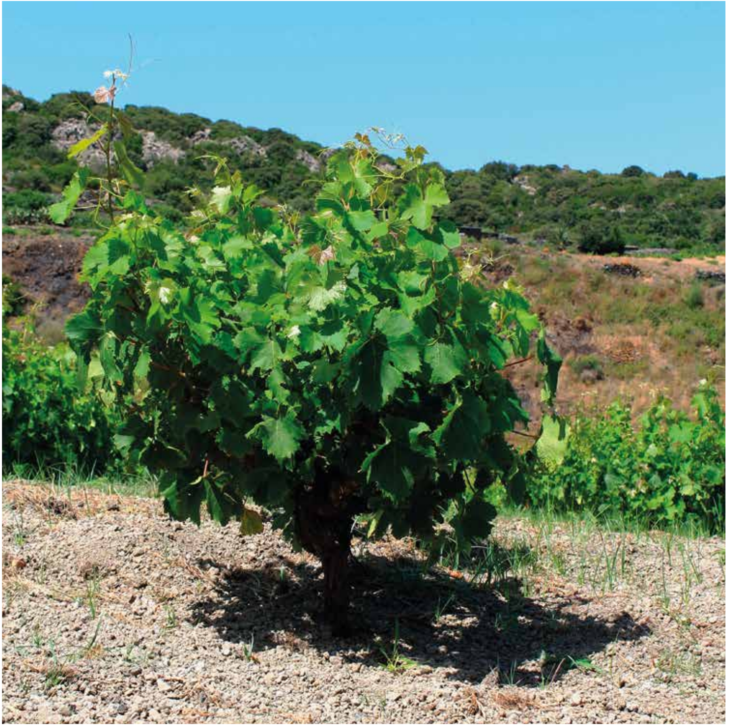
Alberello pantesco typical low bush customary of Pantelleria