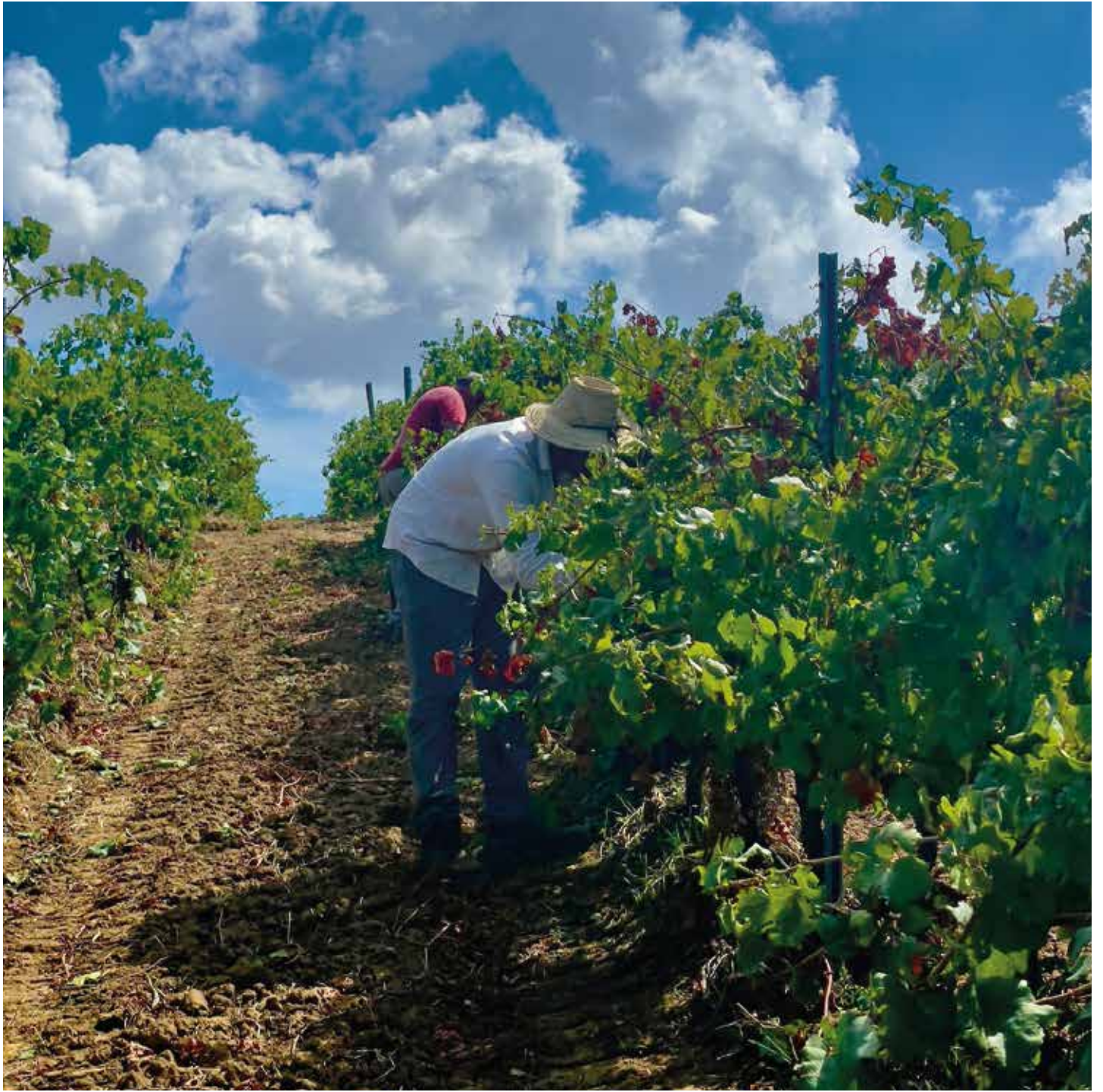
La vendemmia a Pattipiccolo, Alcamo Harvest in Pattipiccolo, Alcamo