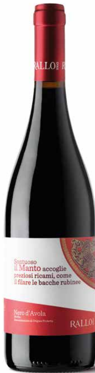
IL MANTO Nero d'Avola Bio Sicilia DOP / Pattipiccolo - Alcamo