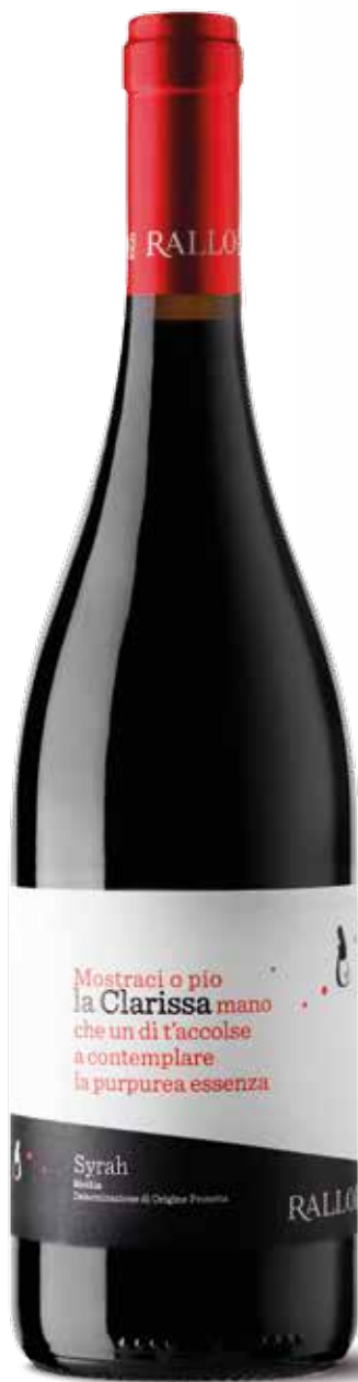
LA CLARISSA Syrah Bio Sicilia DOP / Pattipiccolo - Alcamo