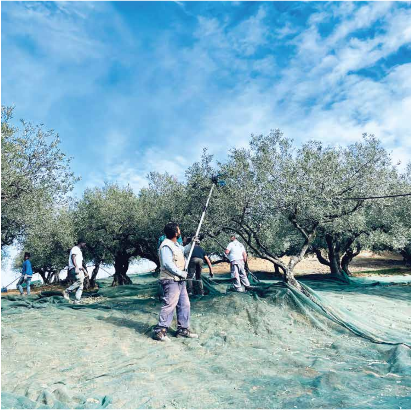
La raccolta delle olive a Pattipiccolo, Alcamo Olive harvest in Pattipiccolo, Alcamo